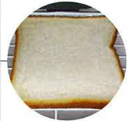
庫内で常温保存した食パン

●2021年11月22日～12月1日(10日間)、 常温保存後に比較検証(当社試験)