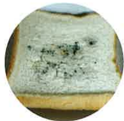
庫外に置いた食パン

約10日間、庫内で常温保存した食パン (写真右)と、庫外に置いた食パン (写真左)を比較。その結果、庫内の 食パンにはカビが発生せず、庫外の 食パンにはカビが発生。