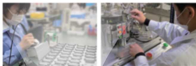
オゾン協会認定工場 JOA1020号