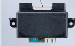
オゾン協会認定番号 JOA-S1401