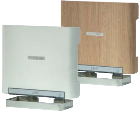
業務用 室内専用オゾン発生装置 AIR FINO エアフィーノ VS-50S